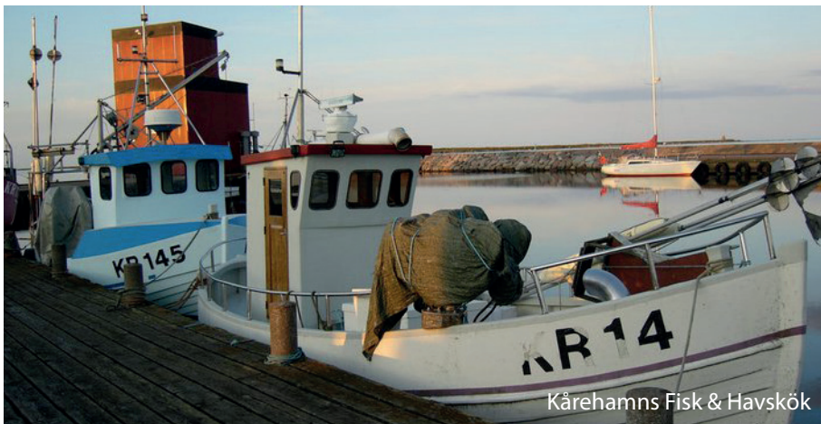
Kårehamns Fisk & Havskök