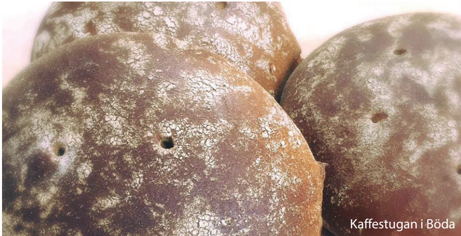
Kaffestugan i Böda