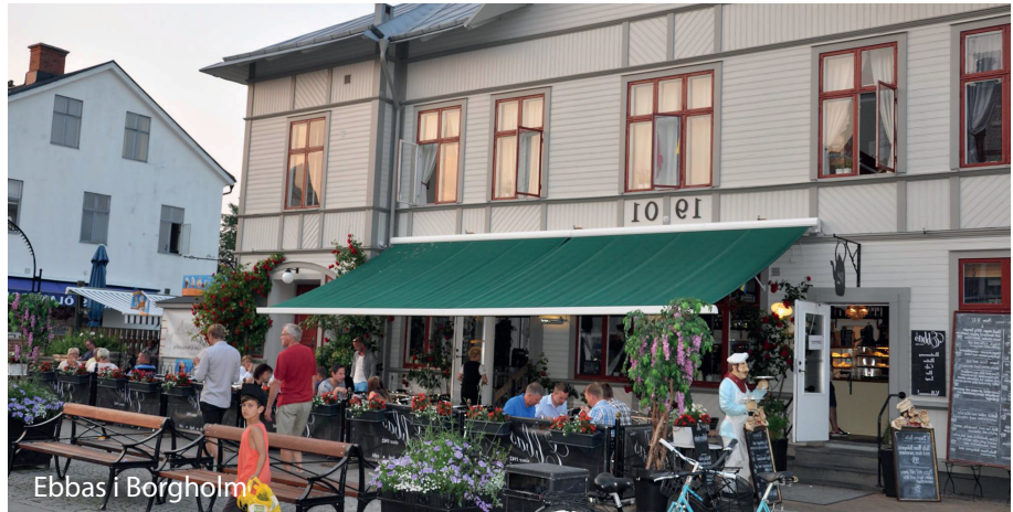
Ebbas i Borgholm