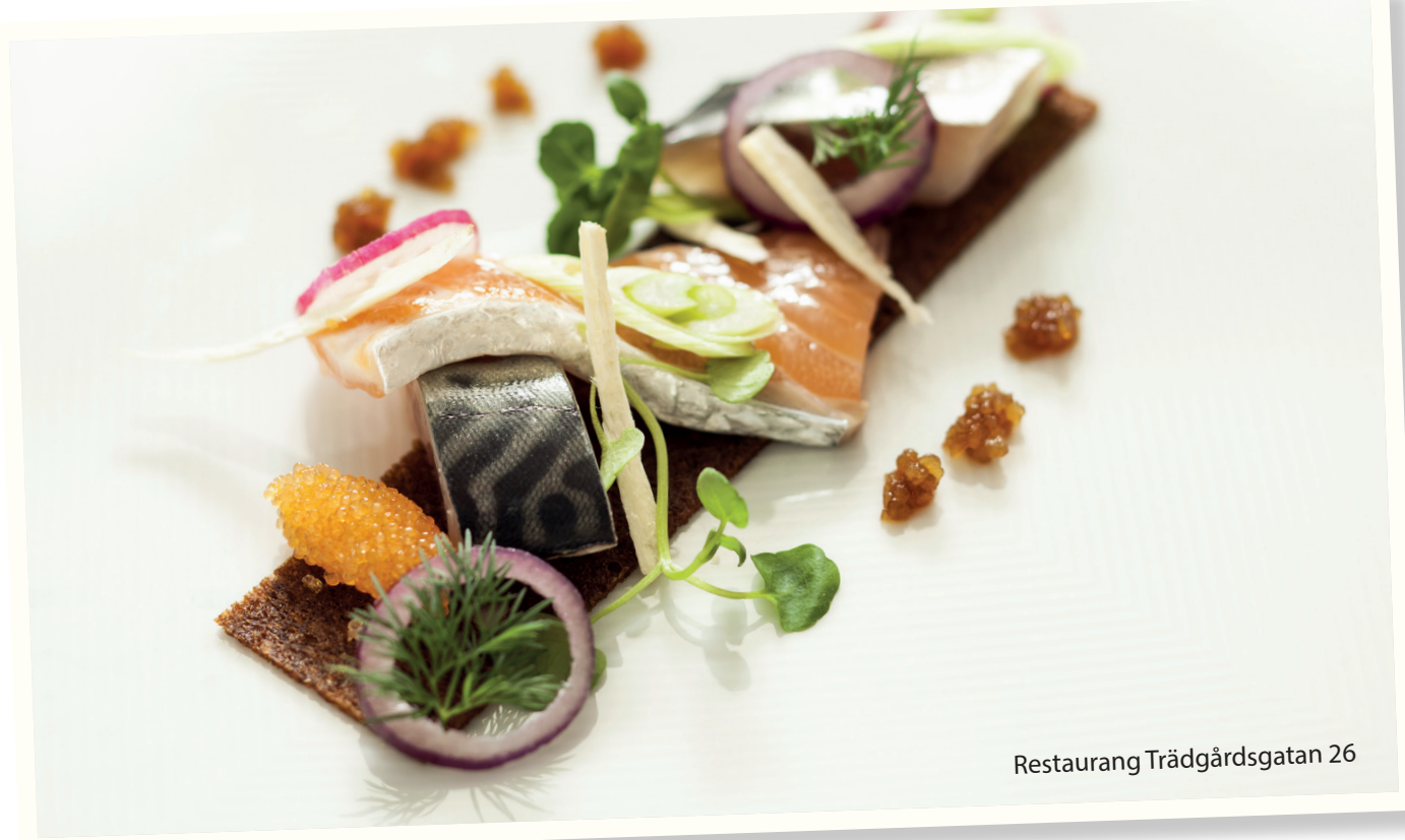
Restaurang Trädgårdsgatan 26