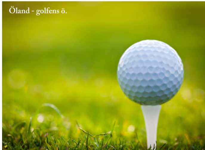
Öland - golfens ö.