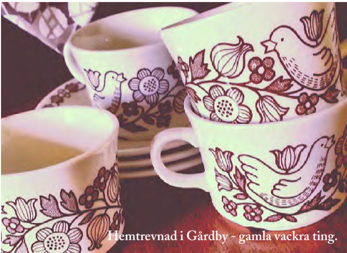
Hemtrevnad i Gårdby - gamla vackra ting.