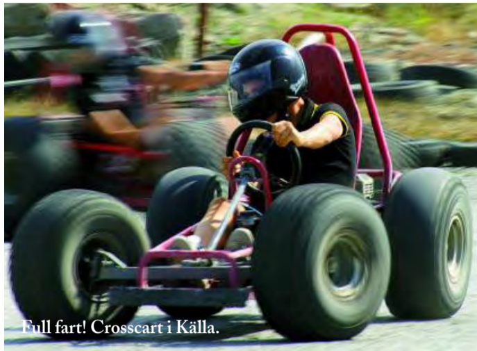
Full fart! Crosscart i Källa.