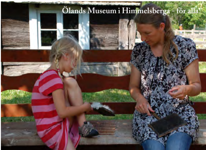
Ölands Museum i Himmelsberga - för alla!